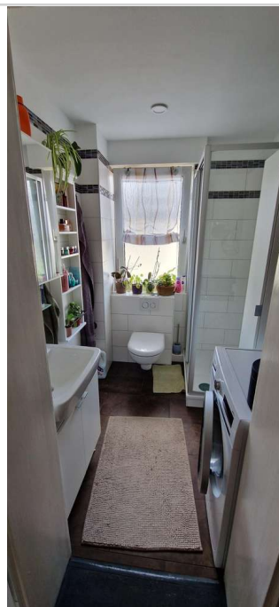
20230725_161957 - Kopie