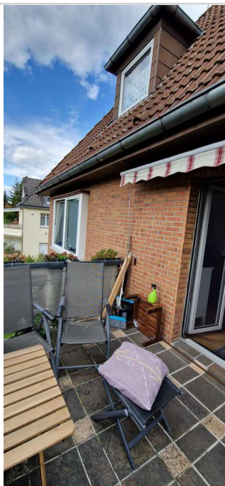
20230725_162048 - Kopie

Zimmer: 9,00 Wohnfläche ca.: 250,00 m 2 Kaufpreis: 799.000,00 EUR