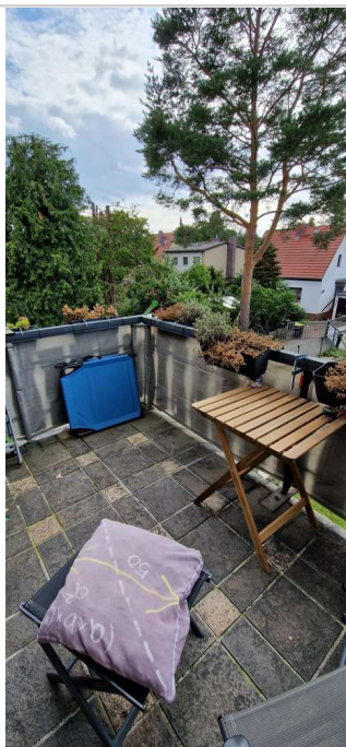
20230725_162039 - Kopie

Zimmer: 9,00 Wohnfläche ca.: 250,00 m 2 Kaufpreis: 799.000,00 EUR