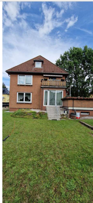
20230725_155842 - Kopie

Bitte haben Sie dafür Verständnis, dass wir aus Gründen der Dokumentationspflicht ausschließlich Anfragen mit kompletten Angaben (Namen, Adresse, Rufnummer) bearbeiten können.