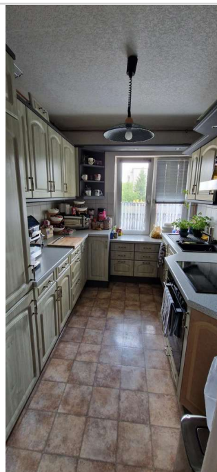
20230725_161932 - Kopie