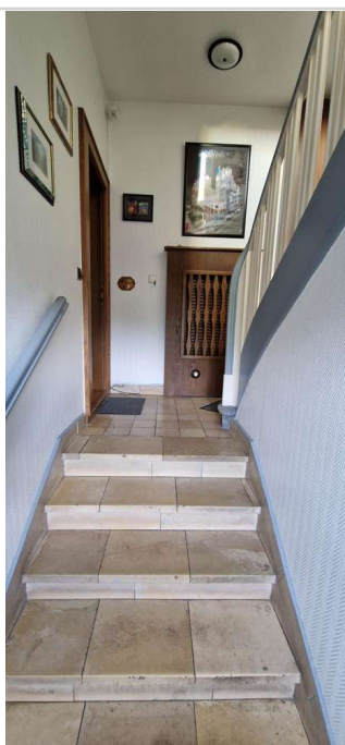
20230725_161448 - Kopie