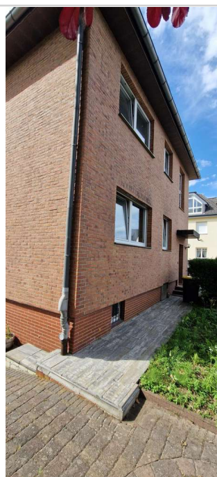
20230725_155531 - Kopie